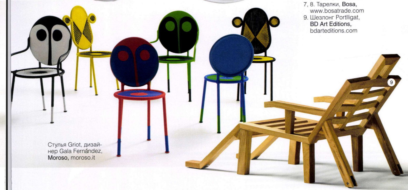
Стулья Griot, дизайнер Gala Fernández, Moroso, moroso.it

Получаются вещи в игровой стилистике. Даже самому строгому интерьеру они придадут нотки юмора и лёгкой иронии. Стилизованные образы людей используют не только в дизайне керамики, но даже проектируя шезлонги и... гардеробные шкафы!